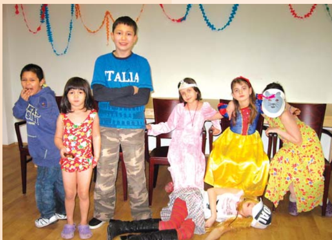
Maškarní karneval v Azylovém domě Gloria.