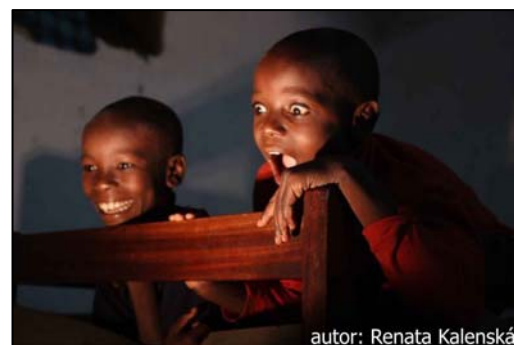
autor: Renata Kalenská

Všechny příznivce rozvojových projektů ADCH Praha také srdečně zveme na výstavu fotografií „ Kongo. Světélko pro děti ulice “, která bude probíhat od 17. do 30. března 2009 ve výstavních prostorách pražského Senátu (Valdštejnské náměstí, Praha 1). Komentované fotografie českých reportérů a pracovníků ADCH Praha upozorní na žalostnou situaci konžských dětí bez domova, jejichž nadějí může být vzdělání, které jim poskytují právě projekty ADCH Praha a řádu Misionářů oblátů Panny Marie Neposkvrněné.